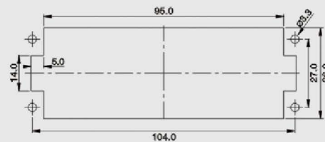
面板安装开孔图 Panel cut out